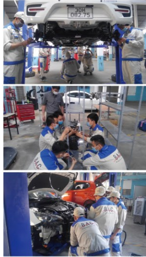
ベトナムでの研修風景

昨年9月からBACベトナム研修センター(ハノイ)で日本語と整備技術の研修(10か月)をしてきた第1期生:17名が全ての研修過程を修了し、7月に同研修センターを卒業しました。そして「技術・人文知識・国際業務」の在留資格(就労VISA)を取得し、8月末、来日しました。全員初めての日本、広島に緊張気味でしたが、当面全員が同じ寮に住み協力しながら日本での生活に慣れ溶け込んでいきます。