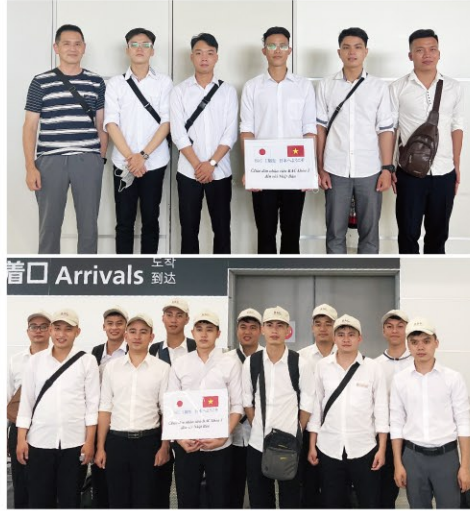
「来日時」空港での様子